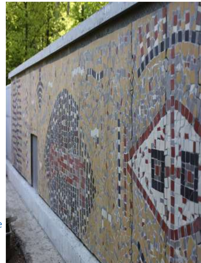
- fot. ZIM ( Zarząd Inwestycji Miejskich )