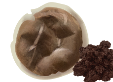
fusy z herbaty i kawy