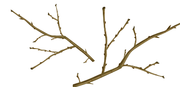
rozdrobnione gałęzie krzewów i drzew