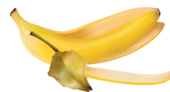
organiczne odpadki kuchenne (np. obierki, resztki warzyw)