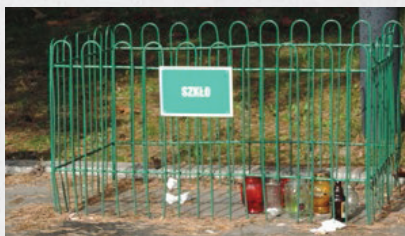
szklane znicze, inne elementy szklane

Na terenie każdego cmentarza komunalnego ustawione są metalowe kosze do segregacji odpadów . Kolorowe pojemniki zawierają opis surowców, które mogą zostać tam wrzucone. Pamiętajmy, że przy pracach porządkowych przy grobach powstają różnego rodzaju odpady komunalne, a część z nich podlega selektywnej zbiórce. Wypalone znicze czy opakowania po środkach czystości należy umieszczać w opisanych i pomalowanych na odpowiednie kolory metalowych (siatkowych) koszach – żółty (plastik, drobne elementy metalowe, tektura), zielony (elementy szklane) i czarny (odpady zmieszane).