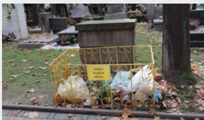
plastikowe znicze, wkłady, butelki, drobne elementy metalowe, tektura, folia