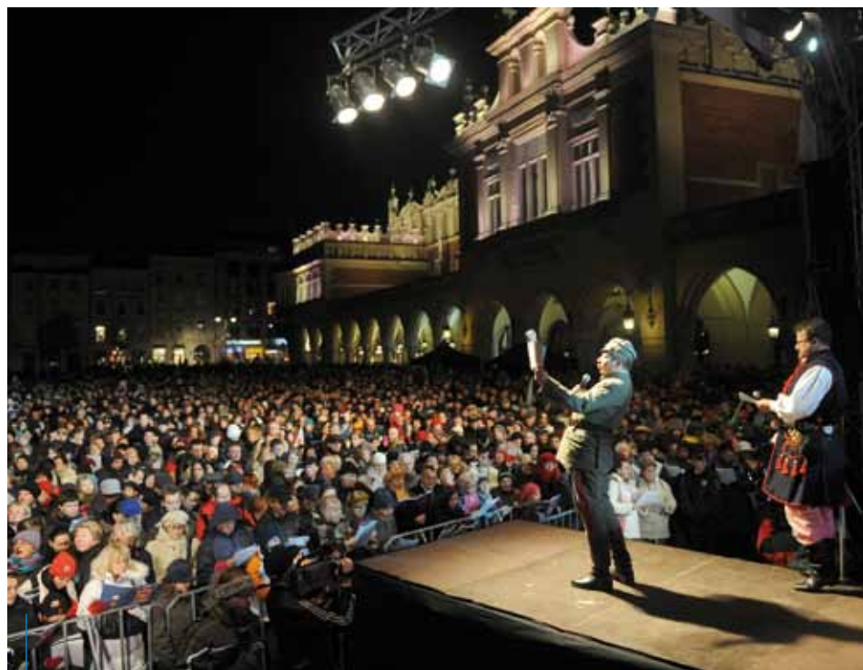
W rekordowych lekcjach śpiewania bierze udział nawet 30 tys. osób!