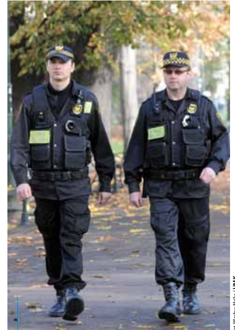
W miastach o bezpieczeństwo lokalne dba m.in. straż miejska