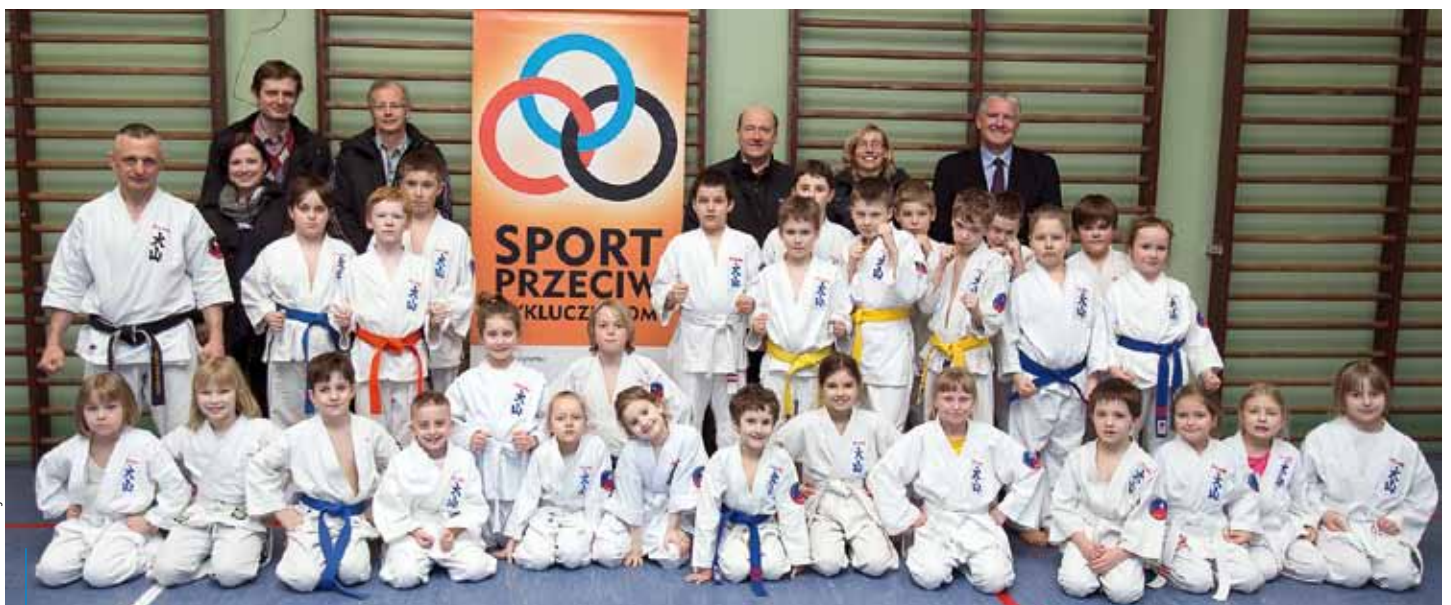
Krakowski Klub Oyama z powodzeniem realizuje miejski program „Sport przeciw wykluczeniom”

Wszystkich zainteresowanych szczegółowymi informacjami dotyczącymi klubu, programu zajęć oraz treningów zachęcamy do odwiedzenia strony internetowej: www.oyama-karate.pl .