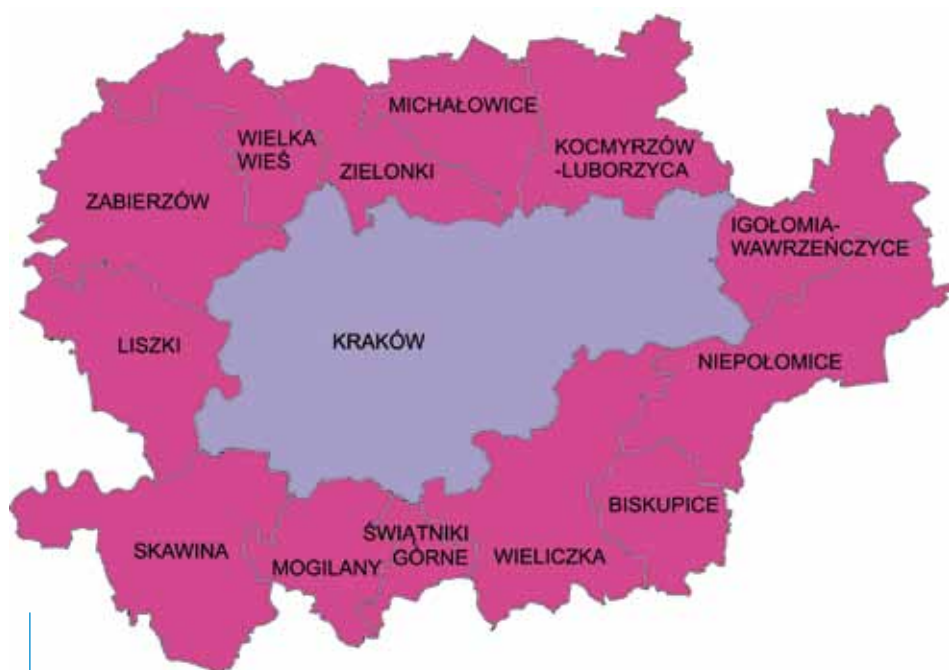
Kraków wraz z sąsiednimi gminami tworzą miejski obszar funkcjonalny

Zintegrowane Inwestycje Terytorialne jako instrument finansowania nowej perspektywy finansowej są zatem szansą zarówno dla Krakowa, jak i dla całego obszaru funkcjonalnego na powodzenie przedsięwzięć, których realizacja do tej pory spotykała się z ograniczeniami formalnymi. Umożliwią równocześnie realizację projektów kompleksowo zaspokajających potrzeby tego obszaru i wpłyną pozytywnie na realizację przedsięwzięć w formie partnerskiej współpracy Krakowa i zaangażowanych gmin.