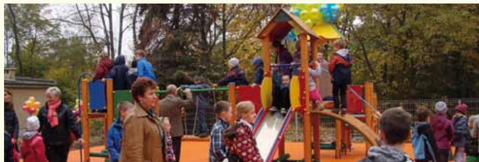
Dzięki zmienionym statutom dzielnic mieszkańcy będą mogli decydować o tym czy w ich sąsiedztwie powstanie np. nowoczesny plac zabaw