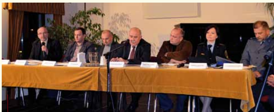
Na spotkaniu, które odbyło się w Centrum Kultury Ruczaj, dyskutowano m.in. o bezpieczeństwie