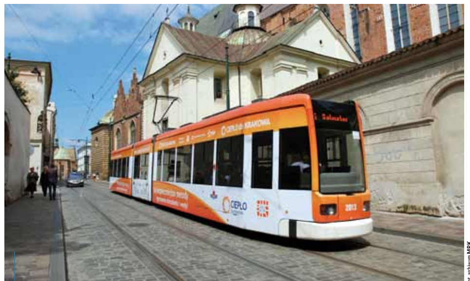
Dzięki reklamie na tramwaju bądź autobusie można dotrzeć do szerokiego grona odbiorców

*specjalista ds. reklamy w MPK SA w Krakowie