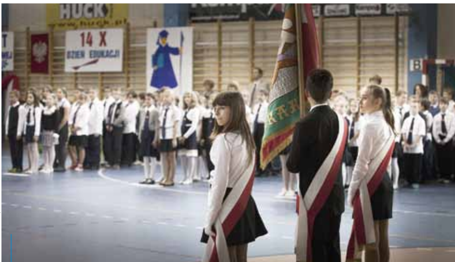
Sportowa Szkoła Podstawowa nr 91 im. J. Kusocińskiego istnieje już 40 lat