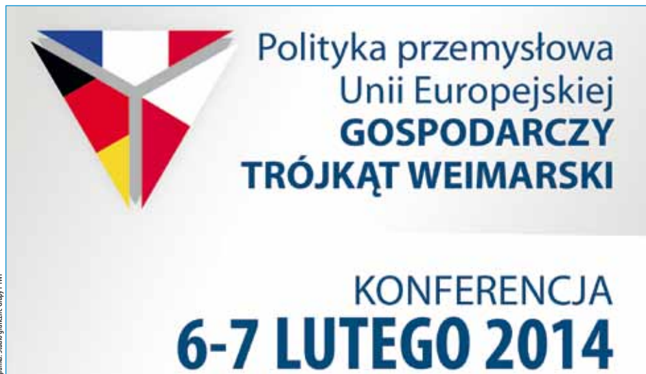
grafika: Studio Graficzne Group P/W/P

Kraków znajduje się w czołówce miast europejskich, które są najczęściej wybierane na miejsce ważnych kongresów naukowych, konferencji biznesowych i branżowych oraz prestiżowych spotkań politycznych. Stolica Małopolski przyciąga wymagających gości zagranicznych i jest niezwykle ceniona przez specjalistów tzw. przemysłu spotkań.