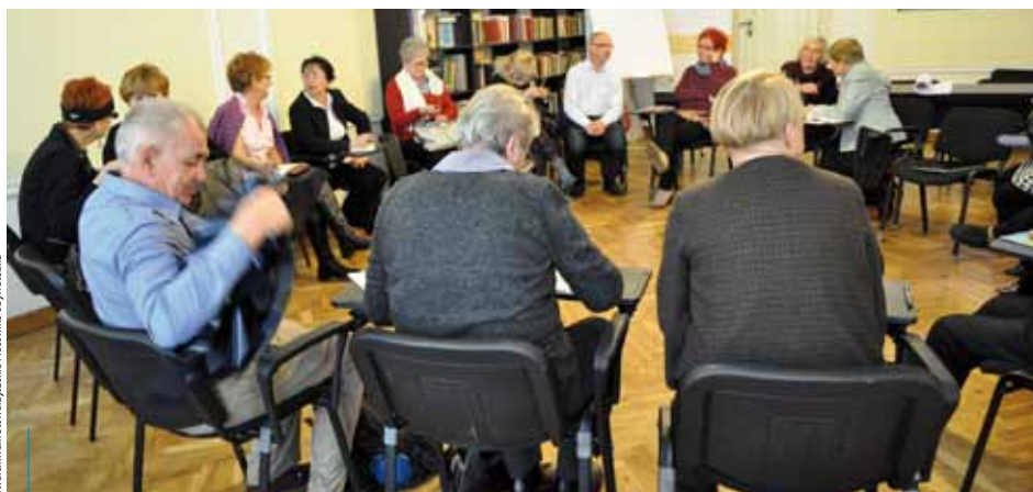
Podczas Warsztatów Obywatelskich 60+ grupa senierek i seniorów przygotowywała się do aktywnego działania na rzecz swojej społeczności, również we współpracy z samorządem

Dialog Obywatelski Seniorów w Krakowie, projekt dofinansowany ze środków Ministerstwa Pracy i Polityki Społecznej w ramach programu Aktywizacja Społeczna Osób Starszych, realizowany jest przez Stowarzyszenie na Rzecz Rozwoju Kapitału Społecznego „Pracownia Obywatelska” wspólnie z Miejskim Ośrodkiem Wspierania Inicjatyw Społecznych.