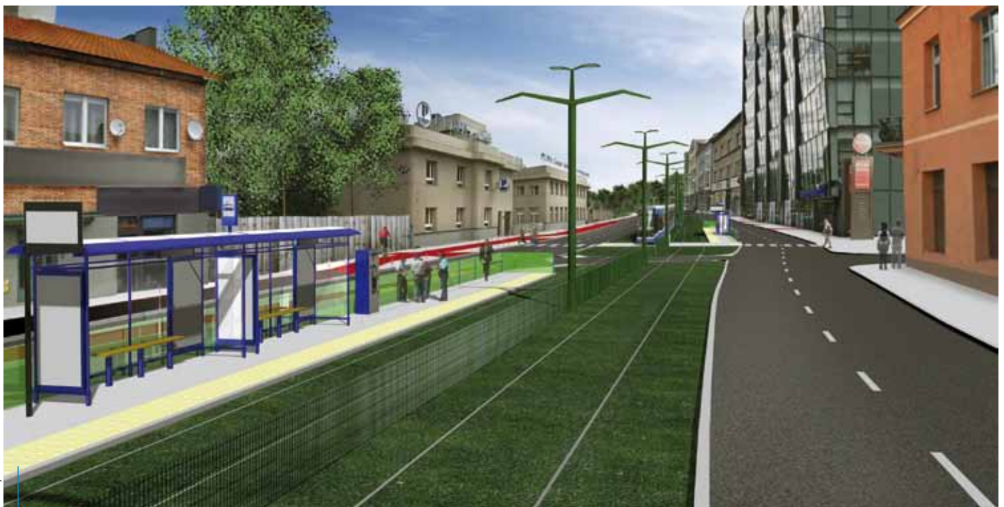
Za niecałe dwa lata przejazd komunikacją tramwajową na odcinku od ronda Mogilskiego do pl. Centralnego będzie szybszy