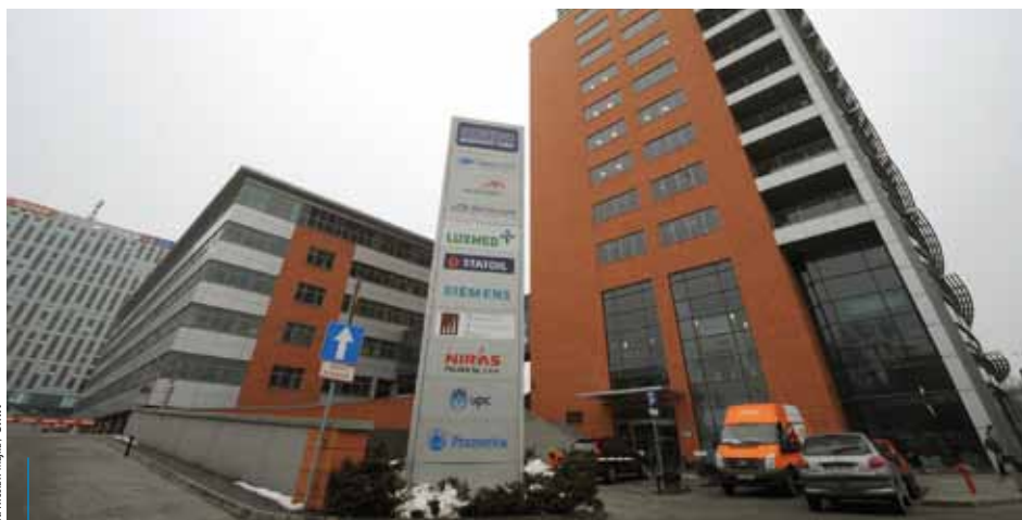
Kraków jest prawdziwą stolicą outsourcingu – działa tu ponad 70 firm z tej branży

Dzięki niemu krakowscy przedsiębiorcy w jednym miejscu mogą załatwić większość formalności związanych z zakładaniem i prowadzeniem działalności gospodarczej, bez konieczności udawania się do innych urzędów i instytucji. Dodatkowo istnieje możliwość internetowej rezerwacji terminu i godziny wizyty.