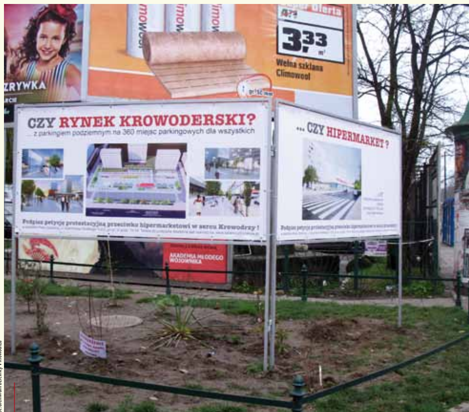
Rynek Krowoderski czy hipermarket?

O niepozornym (choć mającym wielki potencjał) asfaltowym placu pomiędzy ulicami Nowowiejską i Królewską a al. Kijowską pisaliśmy już kilkakrotnie. Mimo wysiłków Rady Dzielnicy V Krowodrza, entuzjazmu mieszkańców i deklarowanej z różnych stron chęci kompromisu sytuacja wydaje się jeszcze daleka od rozwiązania.