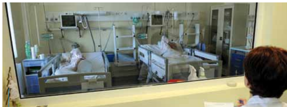
W Szpitalu Miejskim Specjalistycznym im. G. Narutowicza zmodernizowano Oddział Chorób Wewnętrznych

Całkowity koszt zakupów to 1 500 457,27 zł, w tym dofinansowanie z budżetu Miasta Krakowa w 2013 r.: 1 474 050 zł. Warto dodać, że środki z budżetu Miasta przeznaczone na zadania inwestycyjne w Szpitalu Miejskim Specjalistycznym im. Gabriela Narutowicza w latach 1999–2013 wyniosły łącznie 54 389 577 zł.