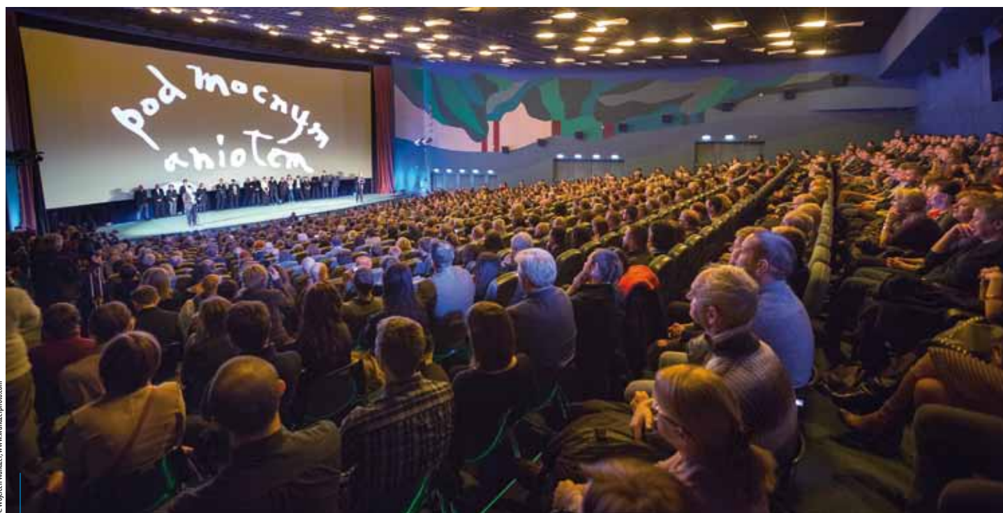
Premiera filmu „Pod Mocnym Aniołem”

Przypominamy: producentem filmu „Pod Mocnym Aniołem” jest Jacek Rzehak, autorem zdjęć – Tomasz Madejski („Lejdis”, „Testosteron”, „Ciało”), a za dystrybucję odpowiada firma Kino Świat. Koproducentem filmu jest Krakowskie Biuro Festiwalowe, a zdjęcia powstawały dzięki wsparciu Krakow Film Commission. Produkcja jest beneficjentem IV Konkursu na Wspieranie Produkcji Filmowej organizowanego przez Regionalny Fundusz Filmowy w Krakowie, finansowanego ze środków Województwa Małopolskiego i Gminy Miejskiej Kraków.