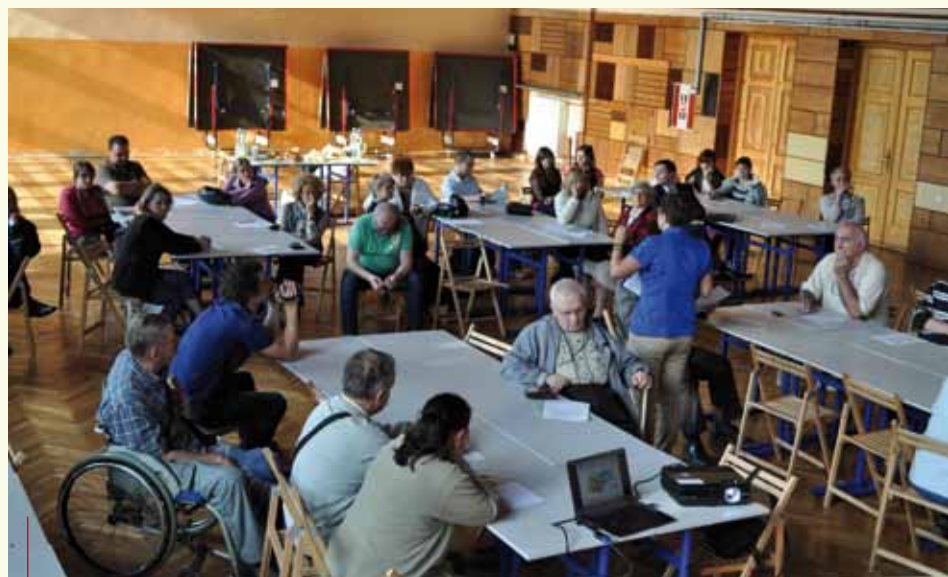
Ubiegłoroczne konsultacje w sprawie budżetu obywatelskiego w Dzielnicy VI Bronowice

Tym razem propozycje mieszkańców zostaną sfinansowane z miejskiej kasy.