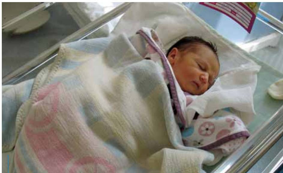
W Krakowie w 2013 r. przyszło na świat 16 589 dzieci

trzebne do zawarcia związku małżeńskiego poza granicami Polski, natomiast 2077 par zdecydowało się na zawarcie ślubu kościelnego.