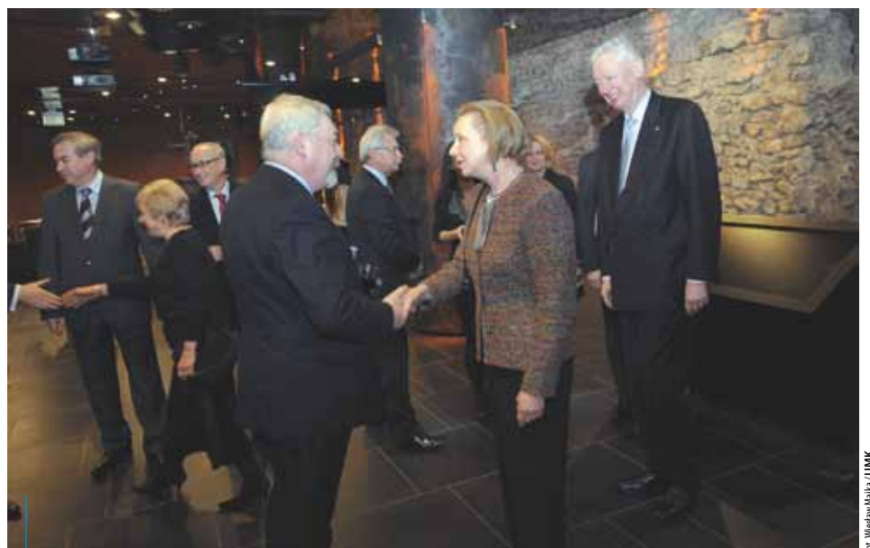
Ubiegłoroczne spotkanie z konsulami odbyło się w Podziemiach Rynku

Stale poszerzające się grono krakowskich dyplomatów to kolejny dowód na otwartość naszego miasta na świat. Ich obecność sprzyja budowaniu pozycji naszego miasta na arenie międzynarodowej, ale również pozytywnie wpływa na komfort pobytu zagranicznych turystów w Krakowie, którzy mając swoich reprezentantów, czują się tutaj swobodniej i bezpieczniej.