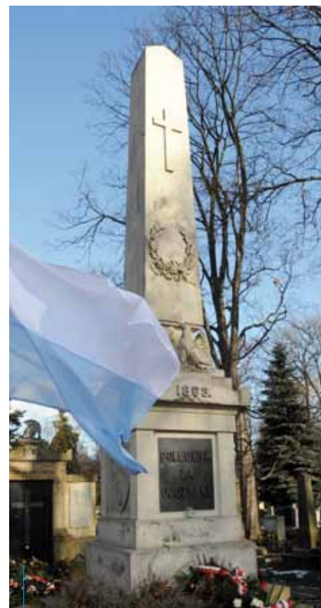
Grobowiec powstańców styczniowych na cmentarzu Rakowickim

wyleczyć rany, tutaj reorganizowały się oddziały po klęskach, tu napływali ochotnicy z Węgier i z Zachodu (baron Wallisch, François de Rochebrune, Francesco Nullo). Tutaj działały punkt werbunkowy i ekspozytura rządu. Krakowianie chętnie wsparli powstanie (wielu poległych w bitwie pod Miechowem to studenci Uniwersytetu Jagiellońskiego, z Krakowa pochodził też jeden z najwybitniejszych dowódców powstania Mar-