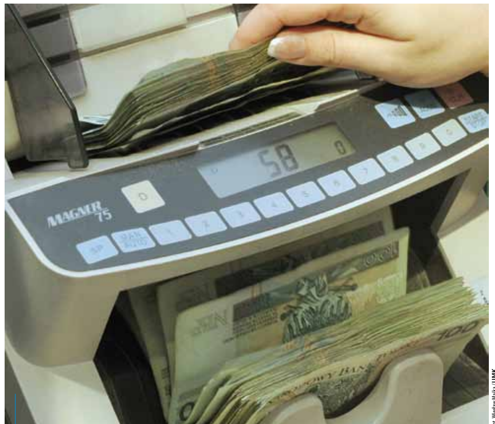
Rok 2013 ma się zamknąć nadwyżką w wysokości 36 203 238 zł

Warto wiedzieć, że ta sama agencja obniżyła też ratingi takim miastom, jak Mediolan czy Turyn, które teraz – zdaniem ekspertów – mają mniejszą wiarygodność niż Kraków.