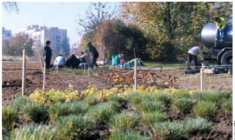
Dzięki projektowi powstaje przyjazna przestrzeń dla mieszkańców

tego, łąkowego charakteru tego miejsca, przy jednoczesnym stworzeniu przyjaznej przestrze-