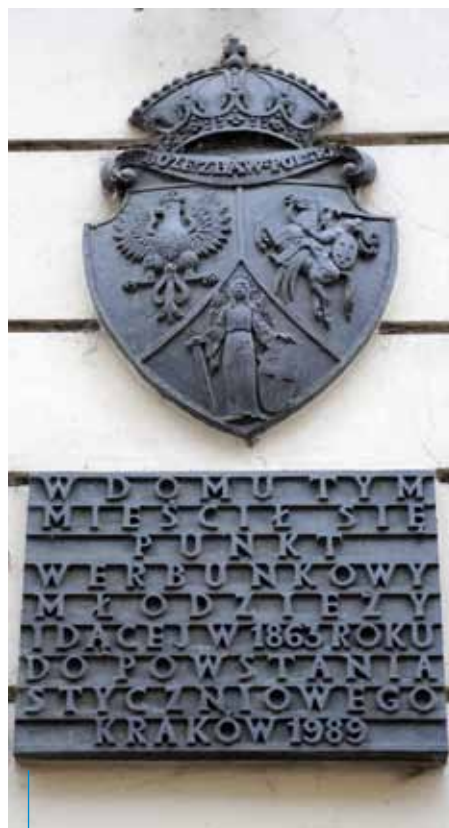
W budynku przy ul. Szpitalnej 7 znajdował się punkt werbunkowy młodzieży idącej w 1863 r. do powstania styczniowego”

Stosunek władz austriackich do wymierzonego przeciwko Rosji polskiego powstania był zastanawiający. Z jednej strony rewizje i aresztowania, z drugiej – zdumiewająca bezczynność. Wspomniany już Józef Kościeszka-Ożegalski pisze w swoich pamiętnikach: „Pewnego dnia, wyszedłszy na miasto, zobaczyłem koło Kleparza konnych powstańców w białych kapotach i czerwonych krakuskach, brakowało im tylko pałaszy i lanc. Dowiedziałem się od nich, że są z oddziału Langiewicza i że przyjechali po zakupno prowiantów, bo stoją obozem w Goszczy, trzy mile od Krakowa. Policja nie zaczepiała ich wcale, widząc uwijających się po mieście”. A jednocześnie podwawelska prasa donosi o rewizjach i aresztowaniach. Już 3 lutego krakowska Dyrekcja Policji ogłasza, że działania przeciwko Rosji „stanowią zbrodnie zamieszania spokojności i według brzmienia paragrafu 66 ustawy karnej ulegają (sic!) karze więzienia od roku do lat pięciu, przy obciążających zaś okolicznościach karze ciężkiego więzienia od pięciu do lat dziesięciu. Ostrzeżenie przeto mieszkańców miasta Krakowa,