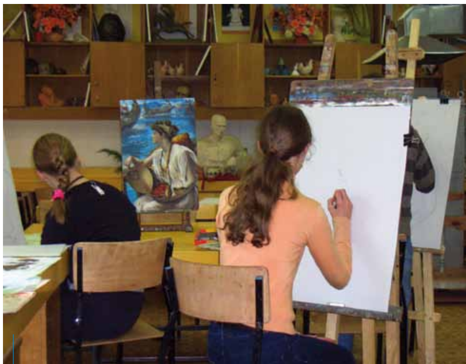
W ofercie Nowohuckiego Centrum Kultury znalazły się m.in. zajęcia plastyczne i ceramiczne dla dzieci

ul. Masarska 14, tel. 12 421-89-92, e-mail: klubstrych@interia.pl