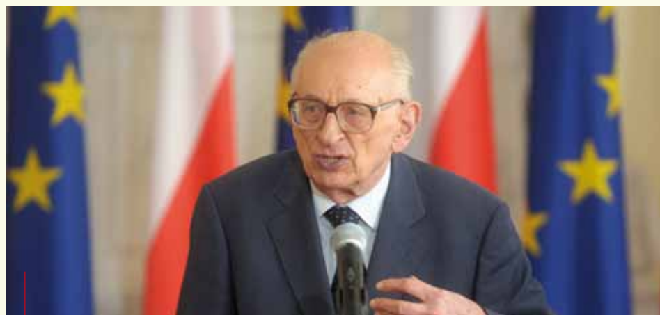
Prof. Władysław Bartoszewski zostanie 36. Honorowym Obywatelem Miasta Krakowa

Z prośbą o nadanie Panu Profesorowi Władysławowi Bartoszewskiemu Honorowego