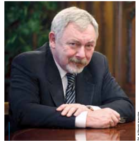
Jacek Majchrowski – Prezydent Miasta Krakowa

Przykład z ostatnich dni – rozdysonowałem tegoroczną rezerwę celową na zarządzanie kryzysowe. Z 3,38 mln zł ponad 1,1 mln zł otrzyma policja – na staże aplikacyjne i 20 radiowozów. Reszta pieniędzy też poprawi bezpieczeństwo miasta – wspólnie ze spółdzielnią mieszkaniową Piaski Nowe sfinansujemy monitoring na osiedlu i rozbudujemy centrum monitoringu przy ul. Cechowej; wybudujemy stanowiska dla przewoźnych motopomp przy ul. Rybnej i Kąkolowej; nie możemy sobie też pozwolić na to, by nasze budynki użyteczności publicznej nie były dostosowane do wymagań przepisów przeciwpożarowych, więc na bieżąco na takie prace musimy wydawać pieniądze. Nie zapominajmy, że to też kwestia naszego bezpieczeństwa, a w tych zadaniach miasta nikt nie wyręczy.