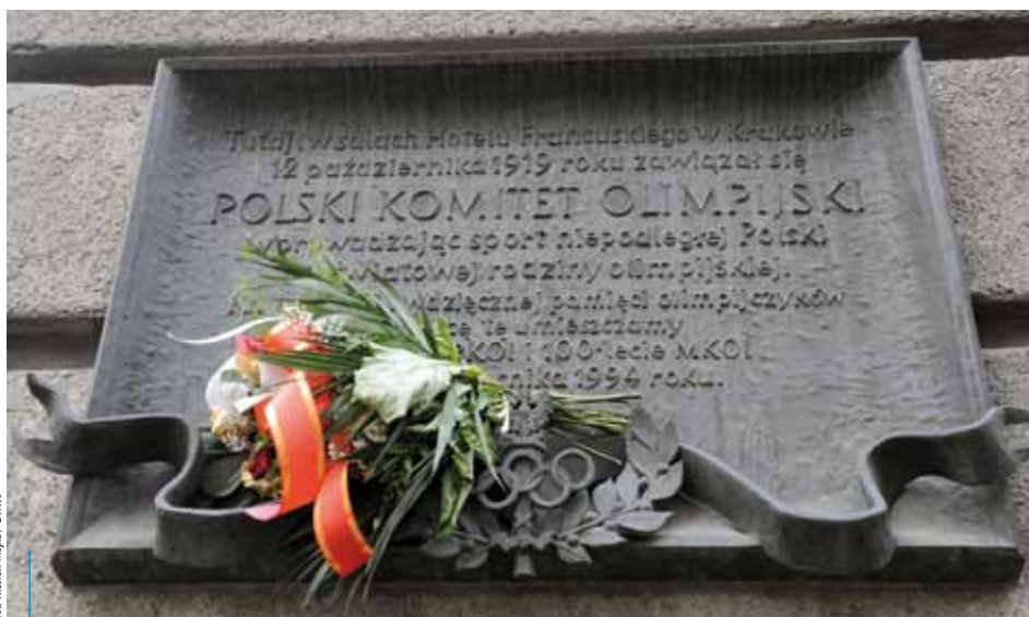
Pamiątkowa tablica o powołaniu Polskiego Komitetu Olimpijskiego znajduje się na budynku Hotelu Francuskiego