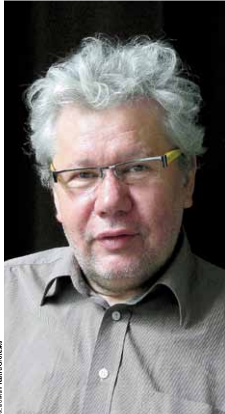
lit. archiwum Teatru Groteska

AW: Tak, ale nie mamy z tym kłopotów. Muszę powiedzieć, że po tylu latach występujący mają do nas olbrzymie zaufanie, wiedzą, że nie zrobimy nikomu krzywdy. I dzięki temu bardzo dobrze nam się współpracuje.