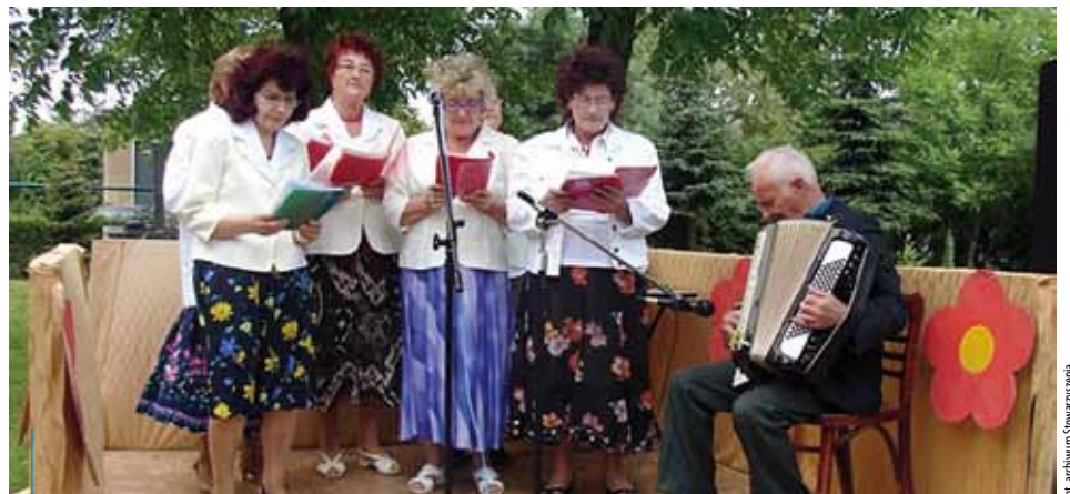
Występ zespołu Wioliny podczas Dnia Mieszkańca

*wiceprezes Stowarzyszenia na rzecz DPS im. św. Brata Alberta w Krakowie