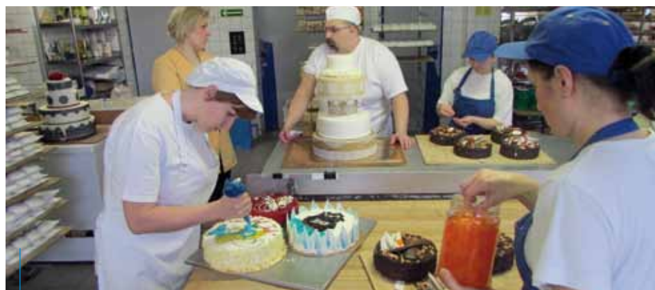
A może tort z cukierni Cora? Zobacz szczegóły konkursu na s. 3!