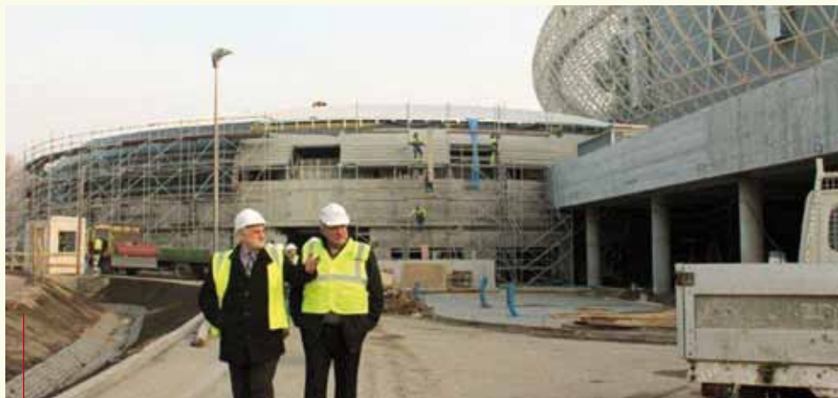
Prace przy Kraków Arena mają zakończyć się do 29 kwietnia