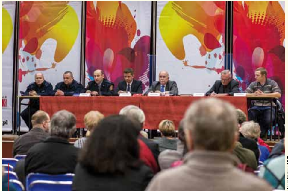
Na spotkanie na osiedlu Podwawelskim przyszło wielu mieszkańców

sowego. Co do bezpieczeństwa, to mieszkańcy odczuwają poprawę jeszcze szybciej, gdyż już wiosną rozpoczną się dodatkowe patrole policji. To