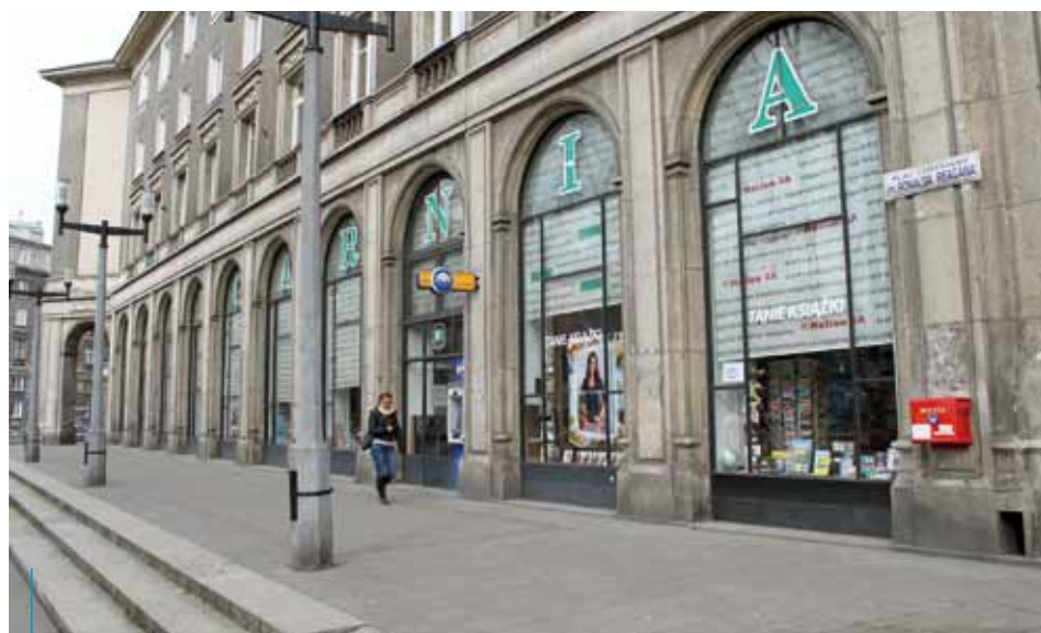
Nowohucka Skarbnica istnieje od lat 50. ubiegłego wieku

*dyrektor Zarządu Budynków Komunalnych w Krakowie