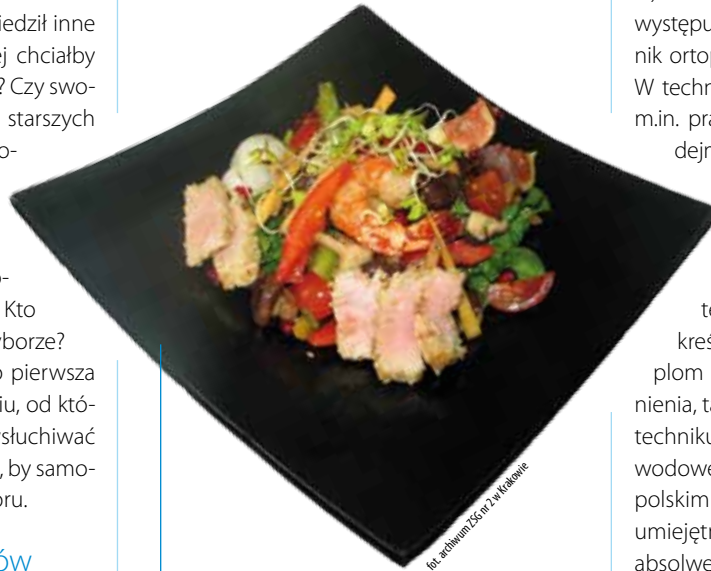
Podczas nauki w technikum można nabyć konkretnych umiejętności – na zdjęciu potrawa w wykonaniu ucznia technikum gastronomicznego

ona etapem kształcenia wymagającym kontynuacji. Liceum przygotowuje do matury i dalszego kształcenia, umożliwia zdobycie wiedzy i umiejętności co najmniej na poziomie podstawowym z zakresu wszystkich przedmiotów ogólnokształcących. Zadaniem liceum jest także przygotowanie uczniów do studiowania na