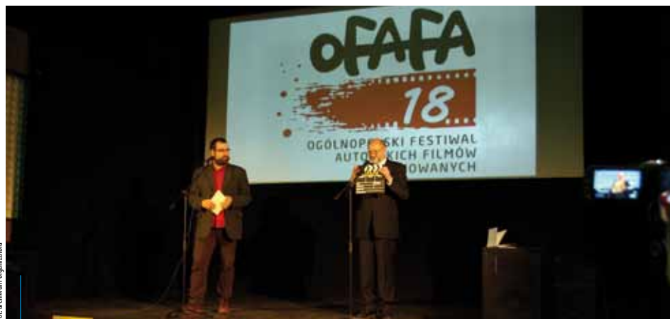
Inauguracja ubiegłorocznej edycji festiwalu

Ogólnopolski Festiwal Autorskich Filmów Animowanych OFAFA w Krakowie to impreza filmowa wpisana w kalendarz festiwalowy polskiej kinematografii od 1993 r. To jedyny festiwal w Polsce poświęcony wyłącznie polskiemu, autorskiemu filmowi animowanemu. Tegoroczna edycja rusza 27 marca.