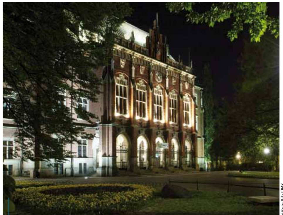
Uniwersytet Jagielloński – najstarsza i jedna z najlepszych polskich uczelni – świętuje w tym roku swoje 650-lecie

Uniwersytet Jagielloński kształci na 78 kierunkach i 149 specjalnościach.