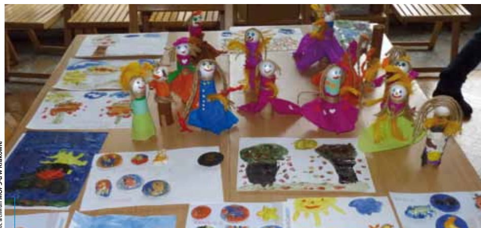
Podczas szkolenia rodziców dzieci się nie nudzą...