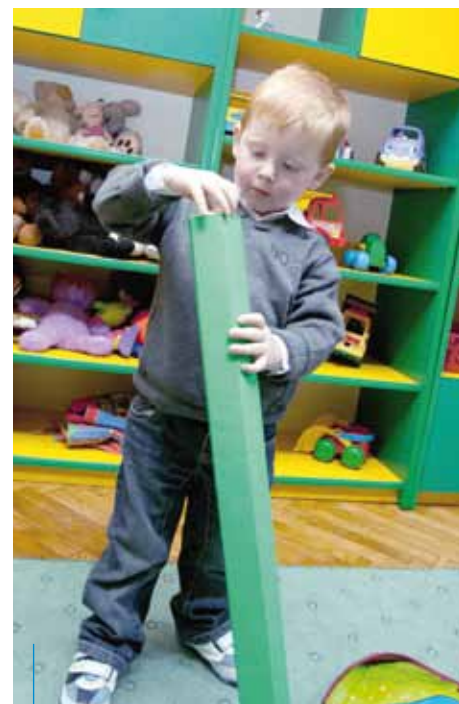
Elektroniczna rekrutacja do krakowskich przedszkoli samorządowych rozpocznie się 1 marca

tą niezdolność do pracy oraz niezdolność do samodzielnej egzystencji na podstawie odrębnych przepisów; dziecko umieszczone w rodzinie zastępczej.