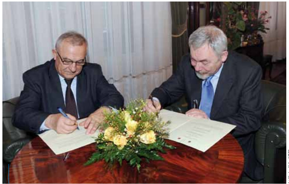
List intencyjny podpisali prezydent Krakowa Jacek Majchrowski oraz rektor Uniwersytetu Rolniczego Włodzimierz Sady

dów. Obiekt planowany w rejonie ul. Balickiej (koło trasy kolejowej Kraków–Balice) ma być włączony do miejskiego systemu park&ride.