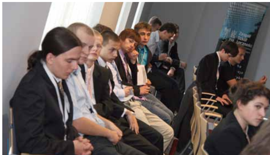
Uczestnicy 5. Festiwalu Informatycznego (2012)

Patronat honorowy nad projektem objęli: Marszałek Województwa, Małopolskiego, Małopolski Kurator Oświaty, rektor Wyższej Szkoły Zarządzania i Bankowości w Krakowie oraz firma IBM. Partnerzy strategiczni to: Krakowski Park Technologiczny oraz Fundacja „Instytut Mikromarko”, a patronatem medialnym przedsięwzięcie wspomagają dwutygodnik miejski KRAKÓW.PL oraz portal „Edukacyjny Kraków”.