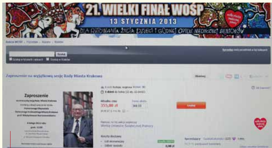
Aukcja WOŚP z zaproszeniem na uroczystą sesję Rady Miasta Krakowa cieszyła się dużym zainteresowaniem